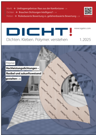
Hinweis in DICT!