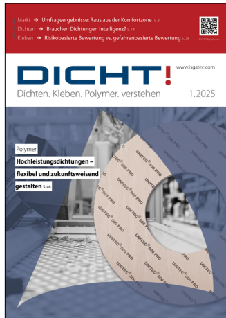
Hinweis in DICT!