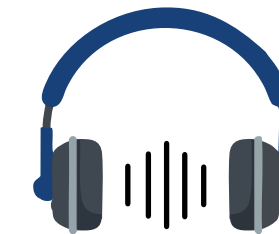
Streambar auf Spotify, Apple Music, Deezer etc.

Podcasts haben sich im B2B-Marketing etabliert. Sie bieten Unternehmen die Chance, komplexe Inhalte verständlich, persönlich und authentisch zu vermitteln – ohne großen Aufwand für die Zielgruppe. Gerade in spezialisierten Industrien wie Dichten. Kleben. Polymer. eröffnen sie neue Wege der Kommunikation: nahbar, praxisnah und professionell.